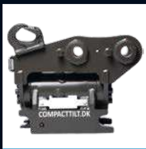
CT6 Max 6T