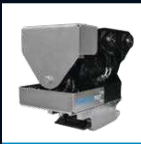
CTR3 Max 3T