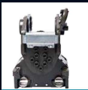
CT10 Max 10T