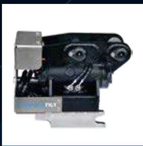
CTR2 Max 2T