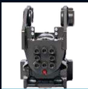
CT3 Max 3T