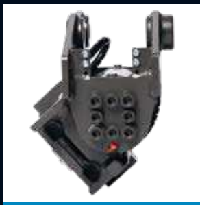
CT2 Max 2T