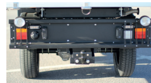
Melex trækker 1.000 kg trailer med bremser på kroge.