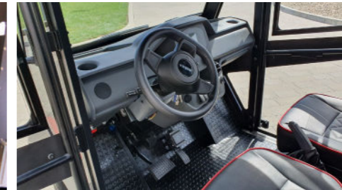
Alle Melex el-bilerne fås med mulighed for lille rat og servostyring.