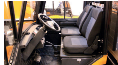
Melex med justerbare separate førerstole.