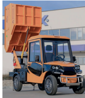
Melex affaldscontainer med højtip. Fås i flere varianter bl.a. med komprimator og sideelevatør.