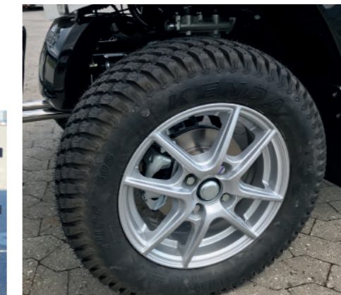
14 tommer alufølge med græs eller helårsdæk.