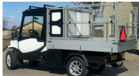
Melex med stort lad og skabsløsning.