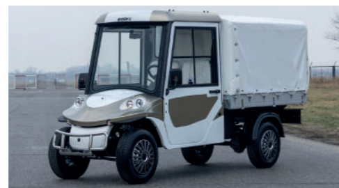
Melex 391 med presenning (overbygning). Mulighed for nem opbevaring af el-håndværktøjer.