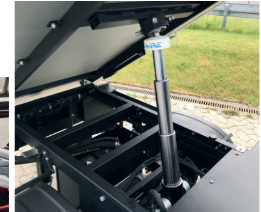
Kraftigt el-hydraulisk tip funktion.