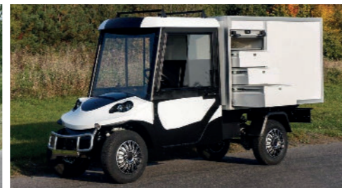
Melex 391 skabsløsning opbygges efter ønske. Her vist med skuffer og bagdør med hylde.