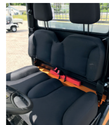
Ergonomisk formet sædebænk i slidstærkt og vaskbart Codura stof er standard på melex 391.1