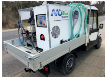
No-Weed 600 varmtvands ukrudtsanlæg her monteret på Melex 300 serien.