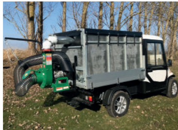
Melex løvsugerkasse. Sugeenheden fås med benzin eller 100% ren el-drift.