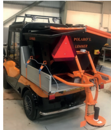
Lehner el-drevet plast saltspreder fås i flere størrelser til montering på Melex.