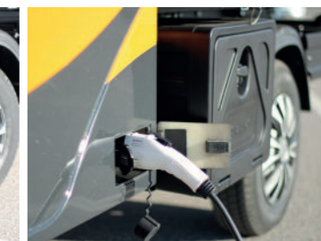
Professionel ladehandske er standard på melex 391.1 serien.