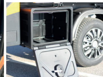
Aflåselige værktøjskasser i begge sider af Melex 391.1 serien.