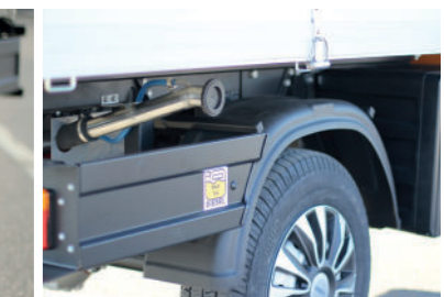
Udvendning tankning af Webasto varmer.