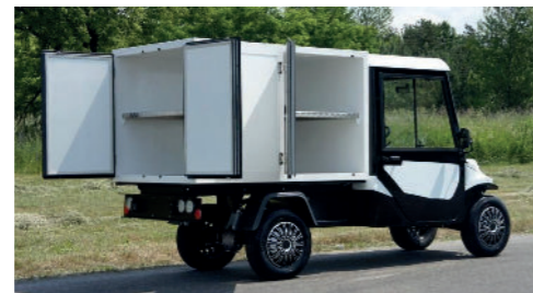
Melex 391 skabsløsning opbygges efter ønske. Her vist med låger og hylde.